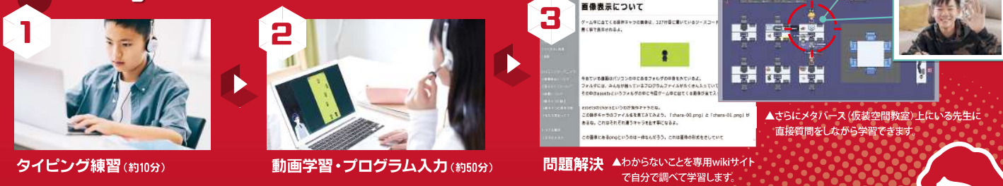
タイピング練習 (約10分)